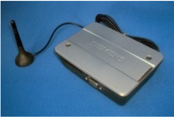
Bild2: Windmaster – väderstationens hjärta.